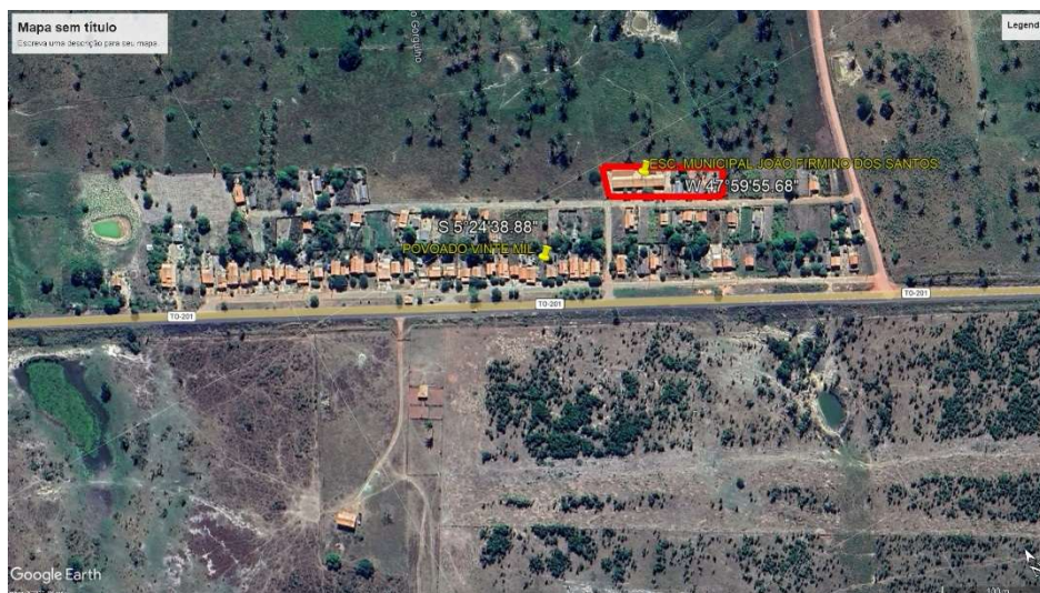
FOTO 3 - LOCALIZAÇÃO DA EDIFICAÇÃO (ESCOLA MUNICIPAL JOÃO FIRMINO DOS SANTOS)